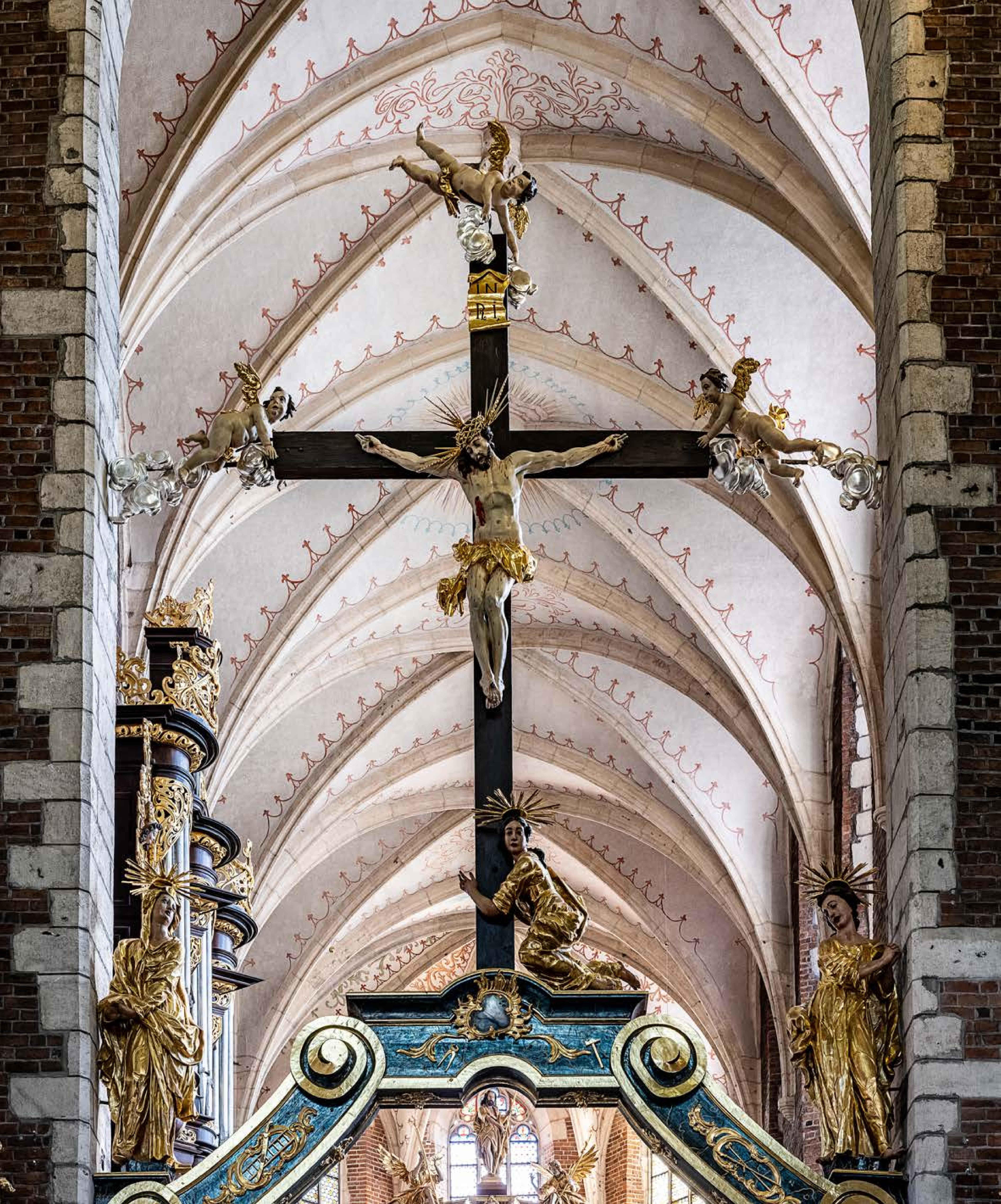
Ukrzyżowanie, z aniołami podtrzymującymi krzyż, rzeźby polichromowane, złoczone, 1763 r., kościół Bożego Ciała, XX. Kanoników Regularnych Laterańskich.