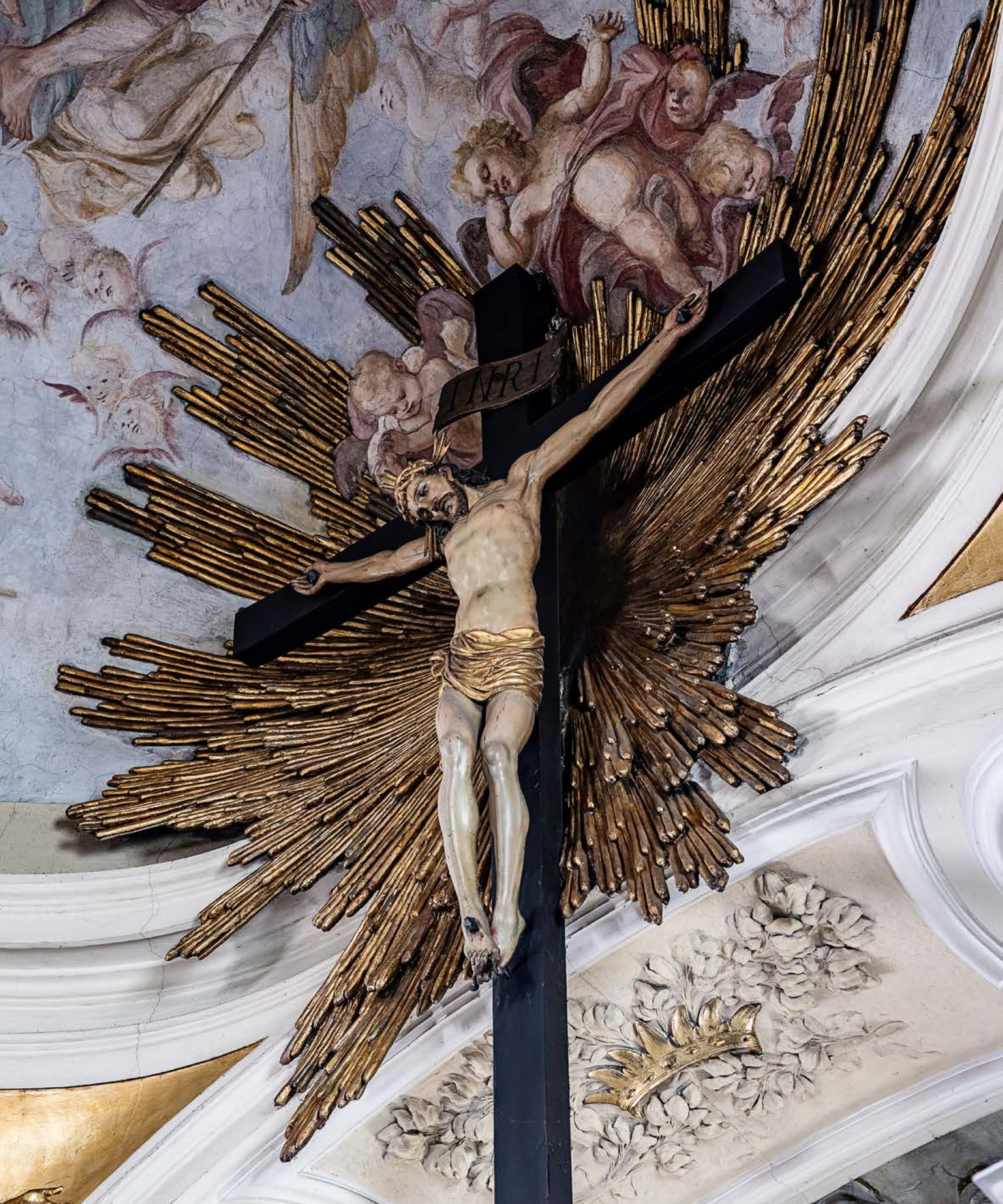
Ukrzyżowanie, w otoczeniu aniołów, rzeźba polichromowana, złocona i polichromia, początek XVIII w., w kościele Św. Andrzeja, SS. Klarysek przy ul. Grodzkiej.