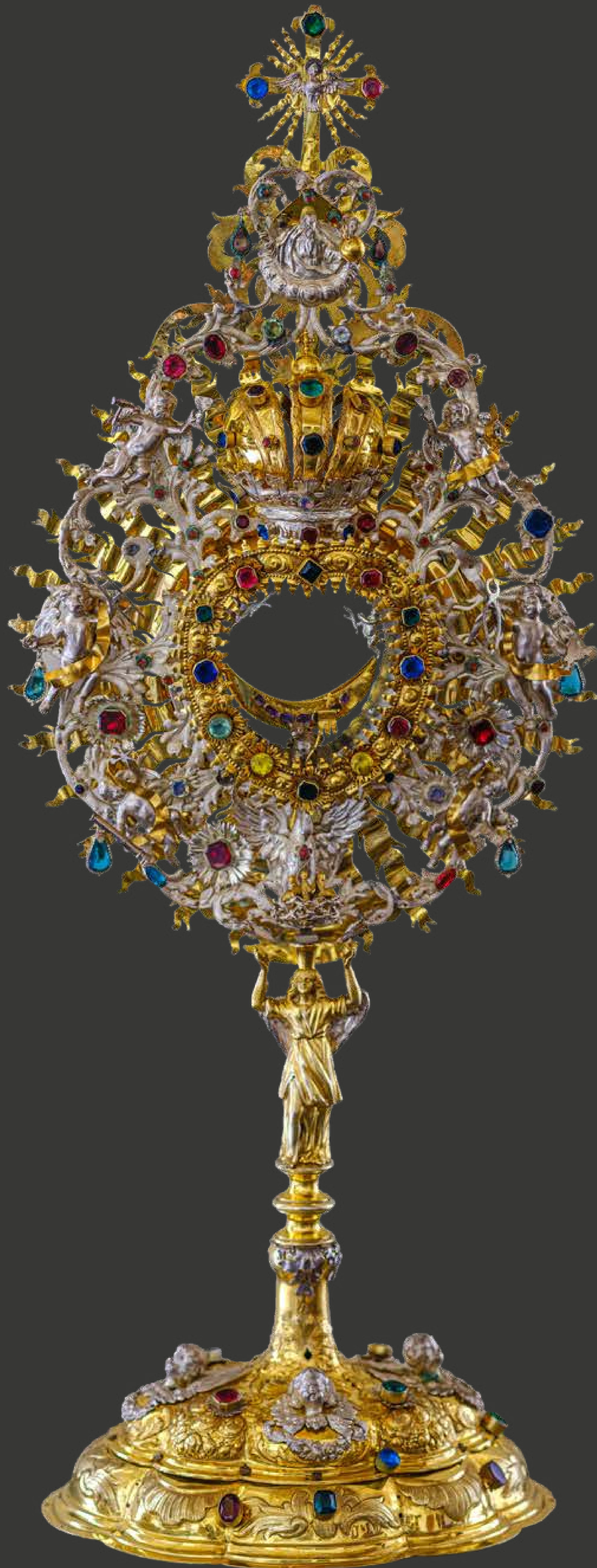
Monstrancja, z trzonem w formie anioła i aniołkami trzymającymi Narzędzia Męki ( Arma Christi ), Niemcy, Augsburg, koniec XVII w., srebro kute, odlewane, złoczone, kameryzacja, w klasztorze OO. Karmelitów Trzewickowych na Piasku.