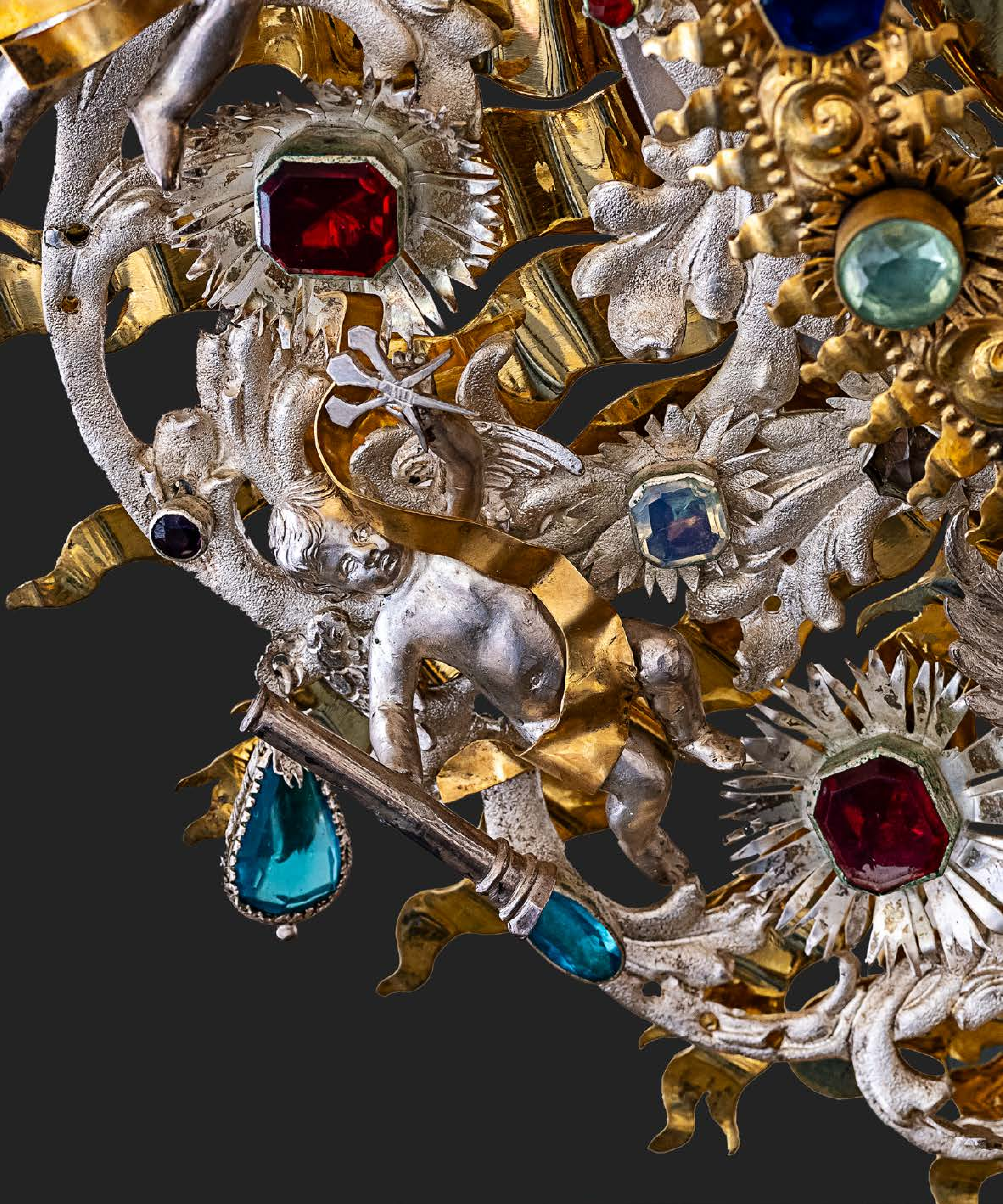
Aniołek z gwoździami ( Arma Christi ), fragment barokowej monstrancji, Niemcy, Augsburg, koniec XVII w., w klasztorze OO. Karmelitów Trzewickowych na Piasku.