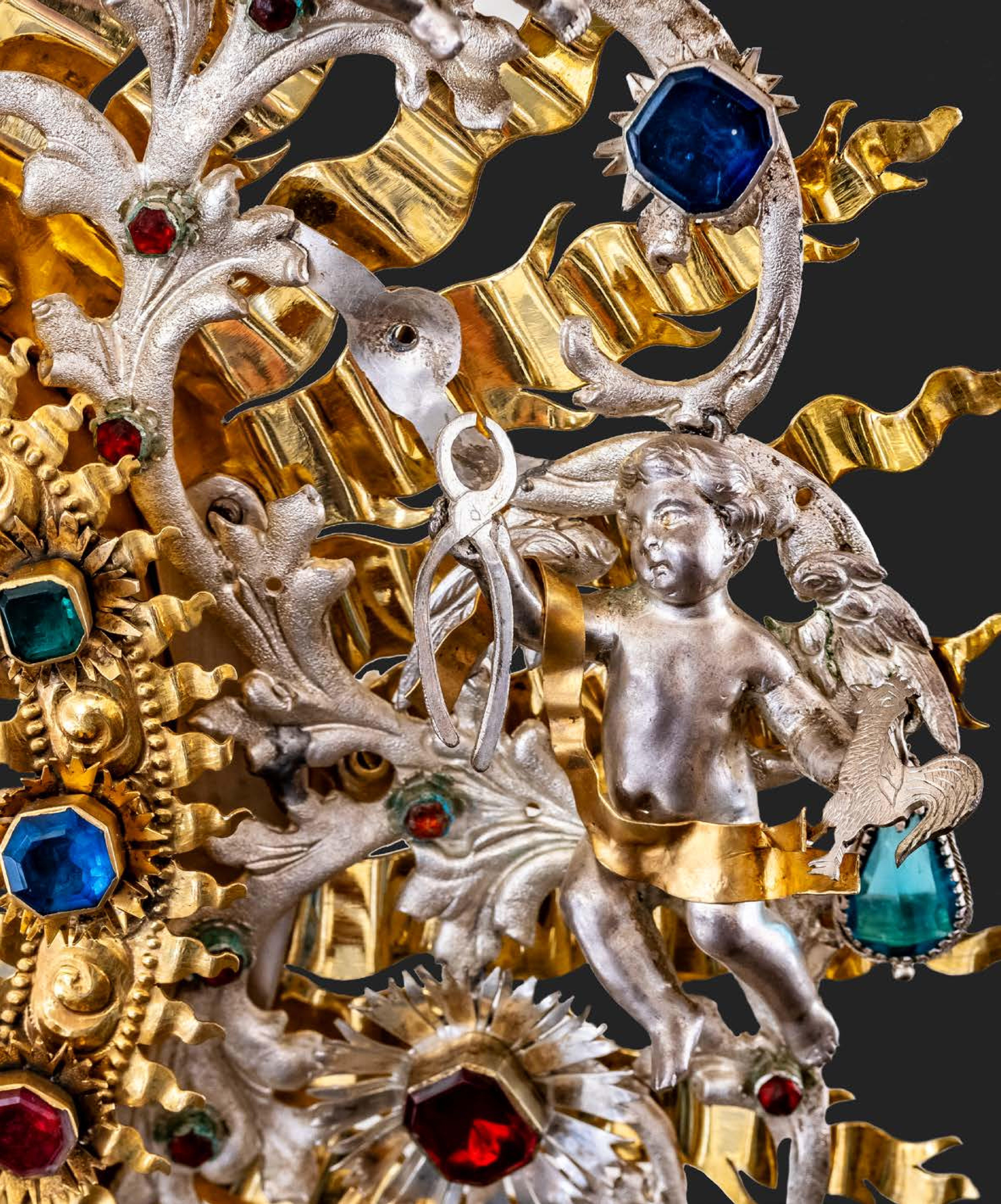
Aniołek z obcęgami ( Arma Christi ), fragment barokowej monstrancji, Niemcy, Augsburg, koniec XVII w., w klasztorze OO. Karmelitów Trzewickowych na Piasku.