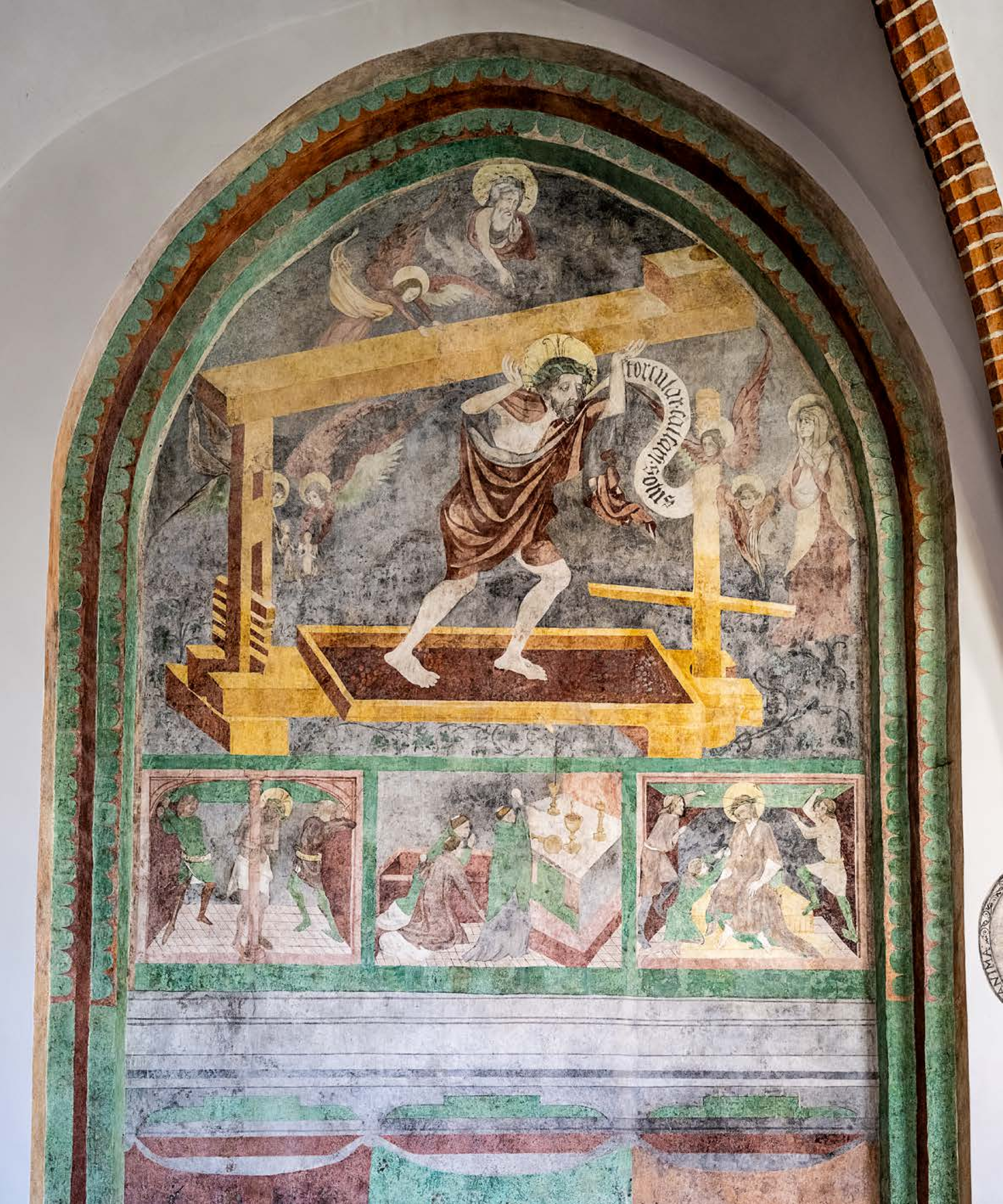
Chrystus w tłoczni mistycznej, po 1436 r., fresk w zachodnim skrzydle krużganków klasztoru OO. Franciszkanów.