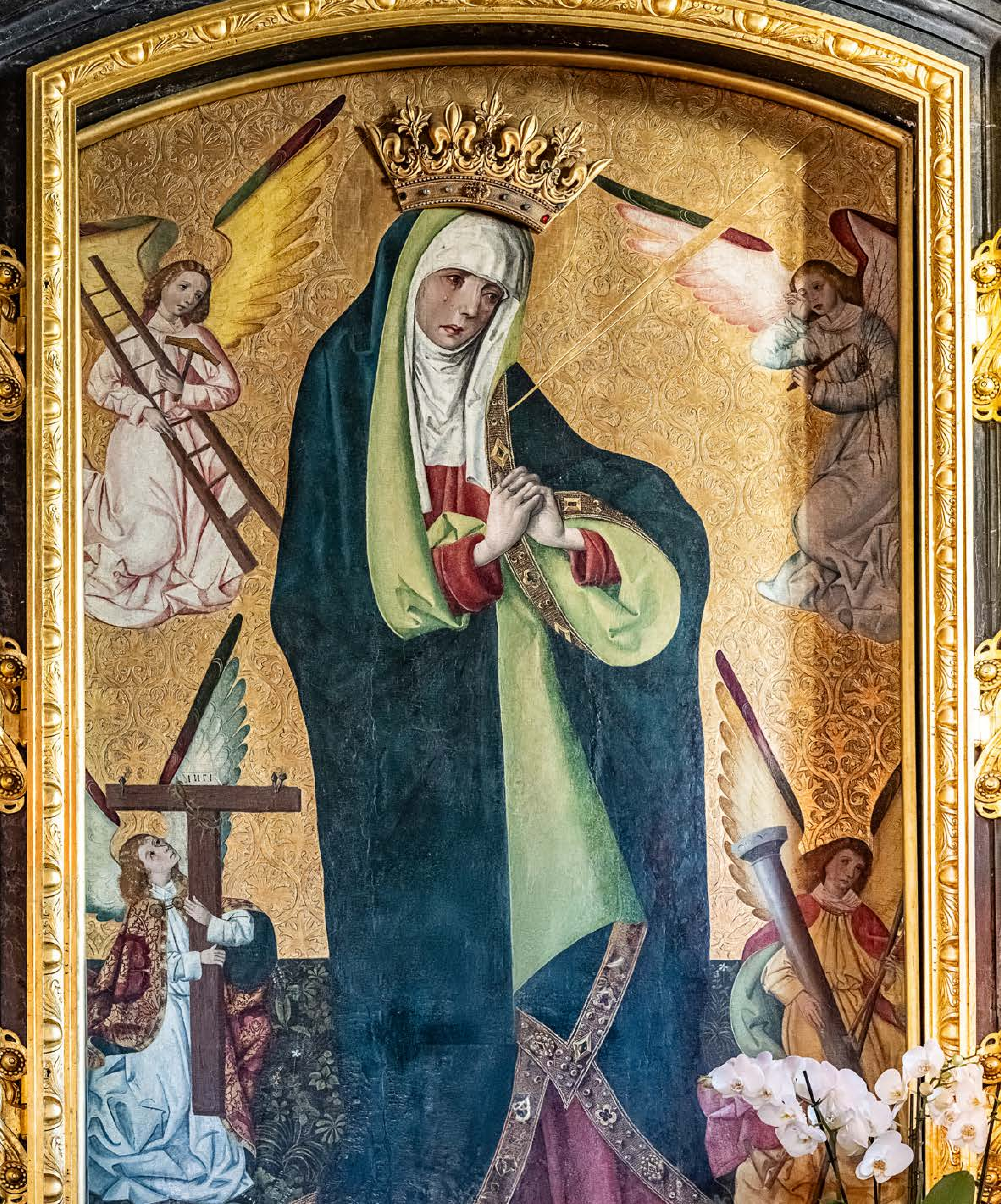
Matka Boska Bolesna, z aniołami trzymającymi Narzędzia Męki ( Arma Christi ), obraz, tempera na drewnie, koniec XV w., w kaplicy przy kościele OO. Franciszkanów.