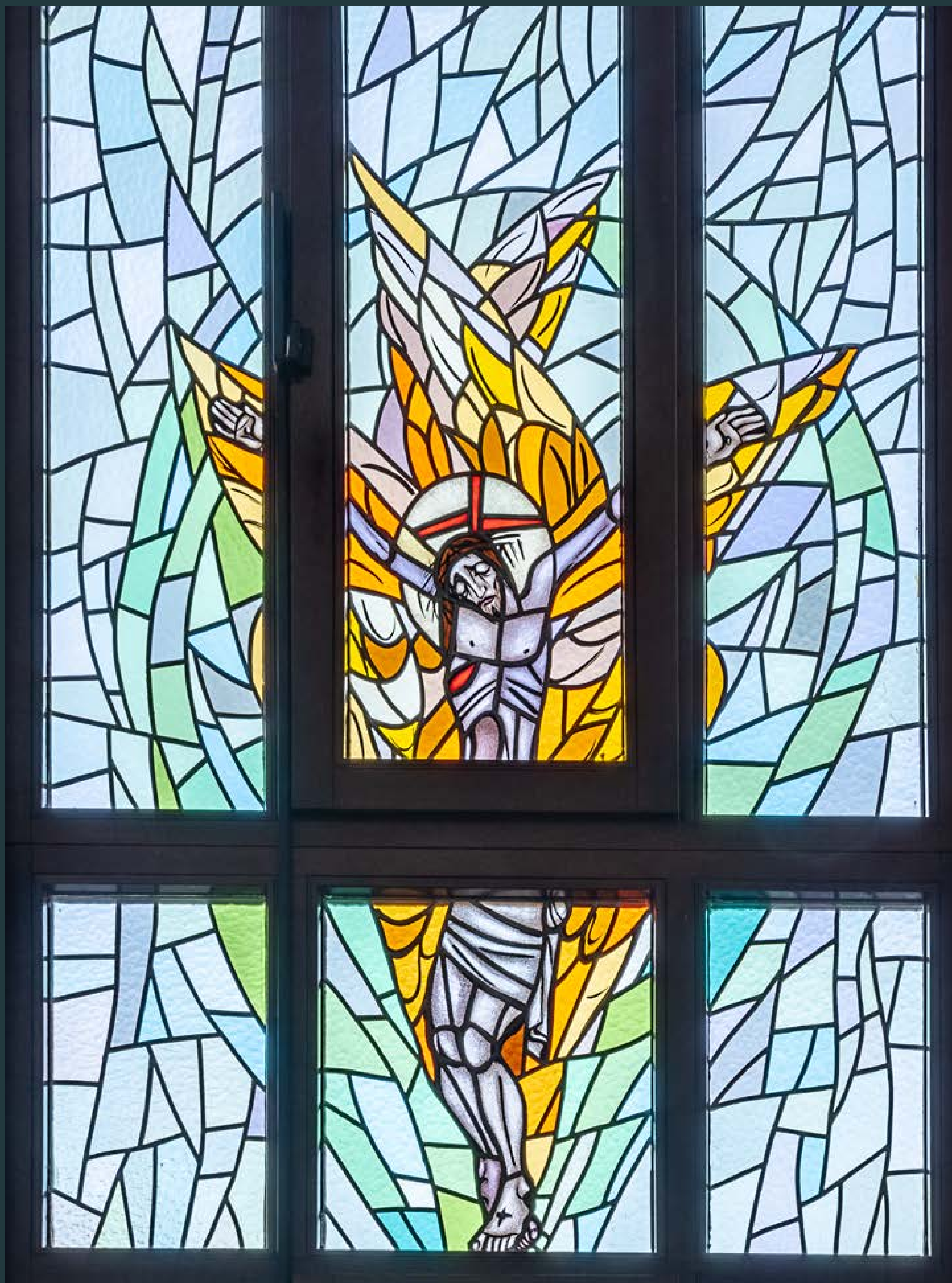
Ukrzyżowany Chrystus jako sześćskrzydły Serafin, fragment witrażu Stygmatyzacja św. Franciszka według projektu Macieja Kauczyńskiego, 2014 r., w kaplicy Domu Generalnego Sióstr Św. Józefa (Józefitek), przy ul. St. Moniuszki.