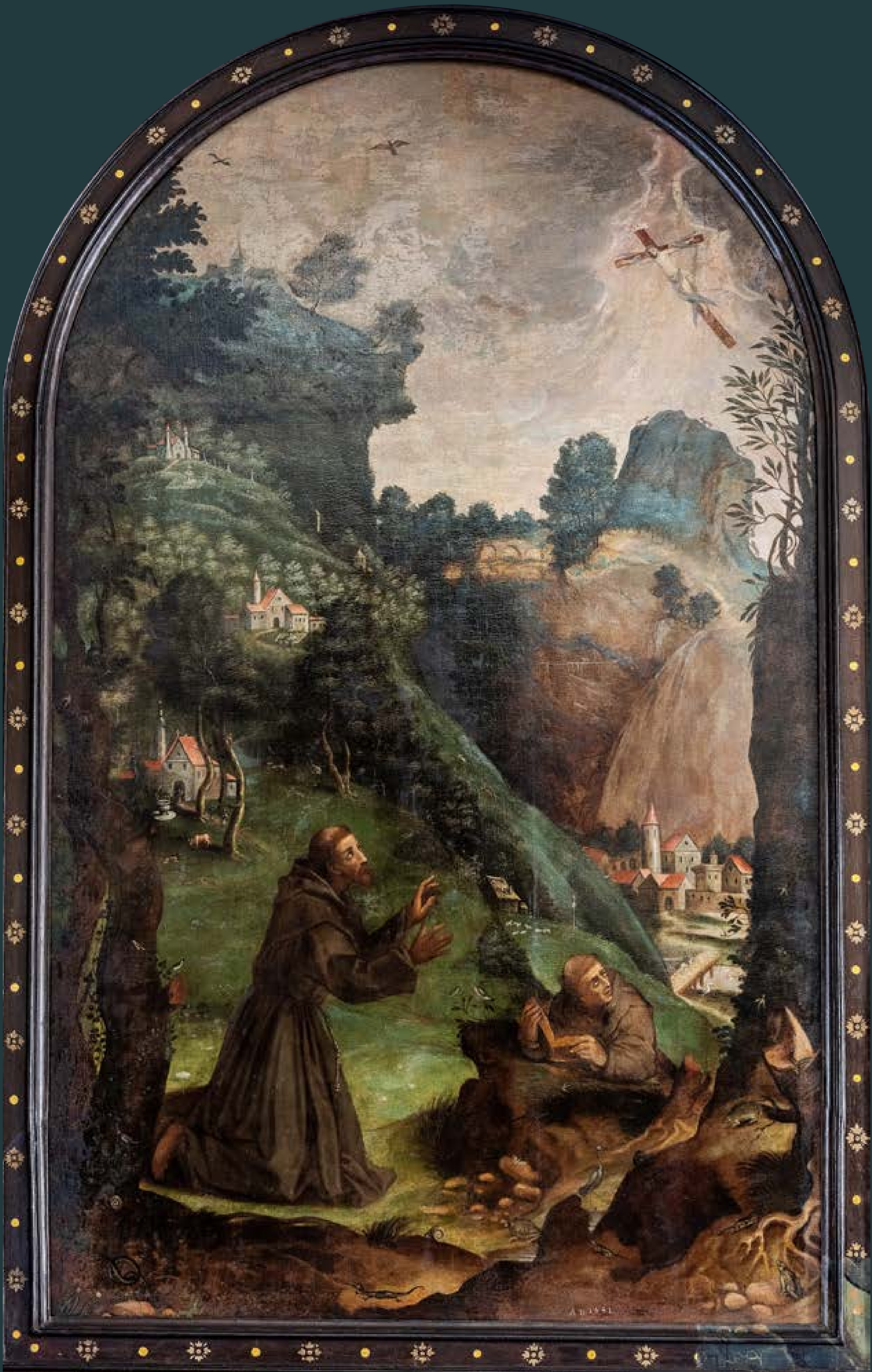
Stygmata św. Franciszka z Asyżu, obraz olejny na płótnie, 1641 r., w klasztorze SS. Klarysek przy ul. Grodzkiej.