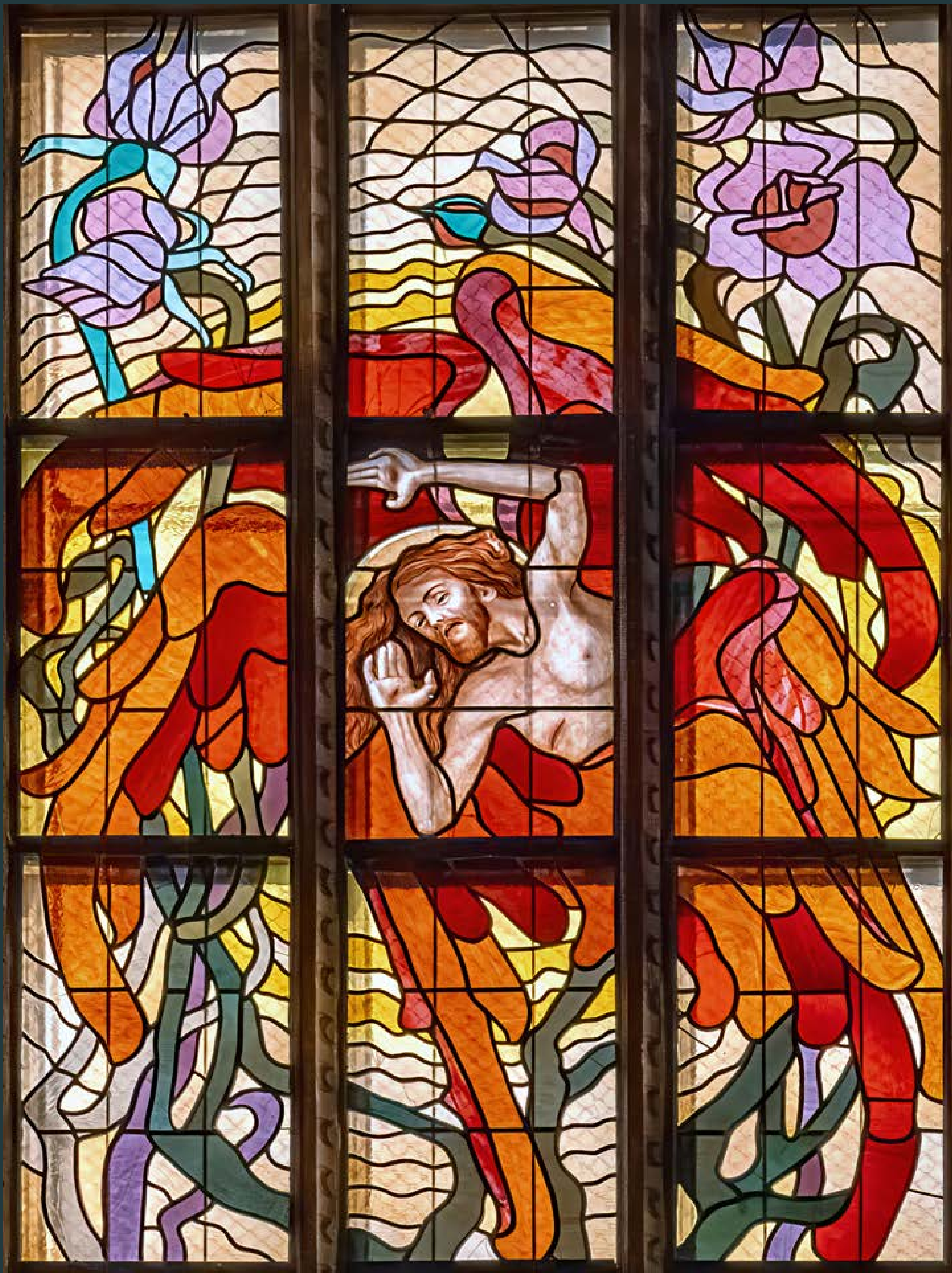
Chrystus jako sześćskrzydły Serafin, fragment witrażu Wizja św. Franciszka z Asyżu według projektu Stanisława Wyspiańskiego, 1899 r., w prezbiterium kościoła OO. Franciszkanów.