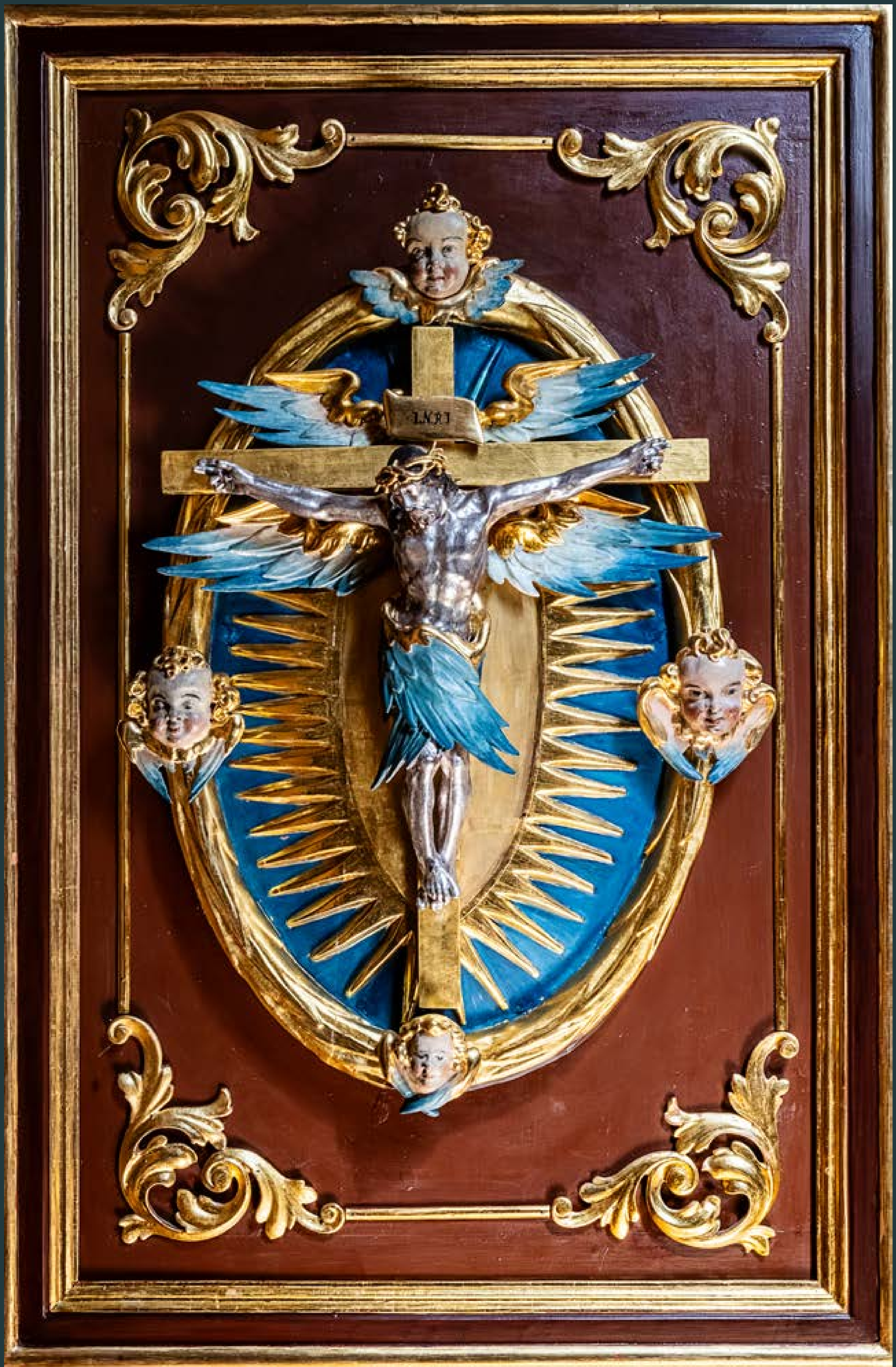
Krucyfiks seraficki, z Chrystusem ukazanym jako Serafin oraz z uskrzydłonymi główkami aniołków, rzeźba drewniana, polichromowana i złocona, połowa XVII w., w klasztorze SS. Klarysek przy ul. Grodzkiej.